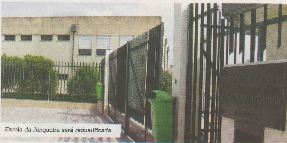
Escola da Junqueira será requalificada

A autarquia salienta que se "trata de mais uma boa notícia para Vila do Conde, neste caso para a comunidade educativa, no prosseguimento do importante trabalho de requalificação do parque escolar, e que confirma a Educação como um setor estratégico na atuação do Executivo Municipal".