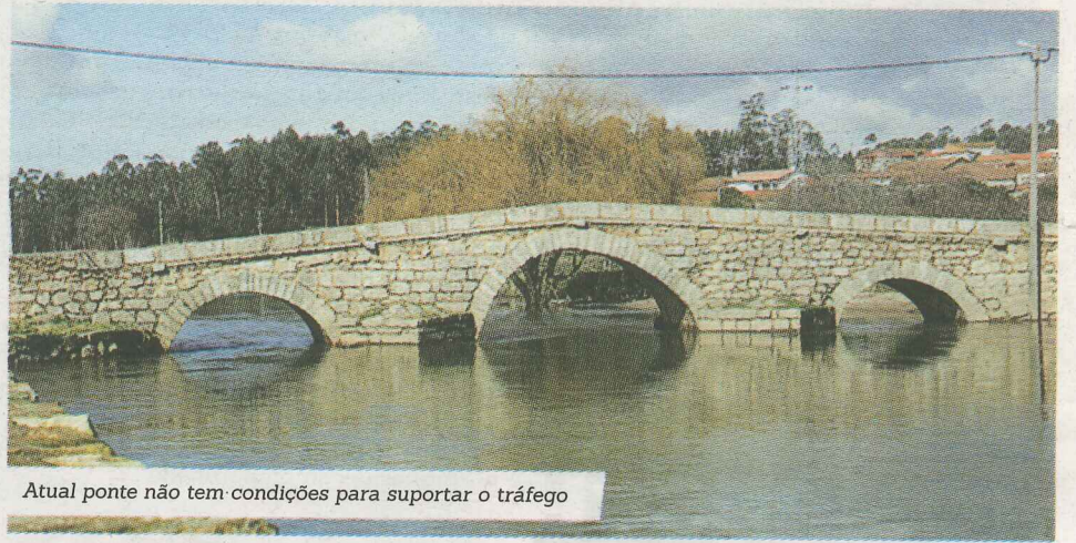
Atual ponte não tem condições para suportar o tráfego

"Com a concretização da construção da ponte rodoviária sobre o rio Este - Arcos, as populações verão concretizado um dos seus maiores anseios. É grande satisfação por ter sido possível resolver um problema de há muitos anos, e sempre foi uma prioridade deste executivo", referiu a autarca.