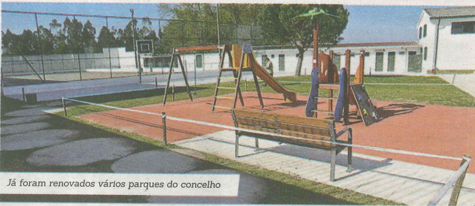
Já foram renovados vários parques do concelho

Está praticamente concluída mais uma fase do plano de renovação dos parques infantis e campos de jogos em inúmeras escolas de todo o concelho, num investimento total que, ao longo de 3 anos, ultrapassa os 500 mil euros.