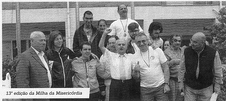
13ª edição da Milha da Misericórdia

Este ano a decoração e enfeite do andor foi da responsabilidade do Centro de Reabilitação Prof. Doutor Jorge de Azevedo Maia, equipamento social de Apoio e Reabilitação para Pessoas com Deficiência da Santa Casa da Misericórdia de Vila do Conde, situado em Fajozes. Utentes e colaboradores dedicaram-se de corpo e