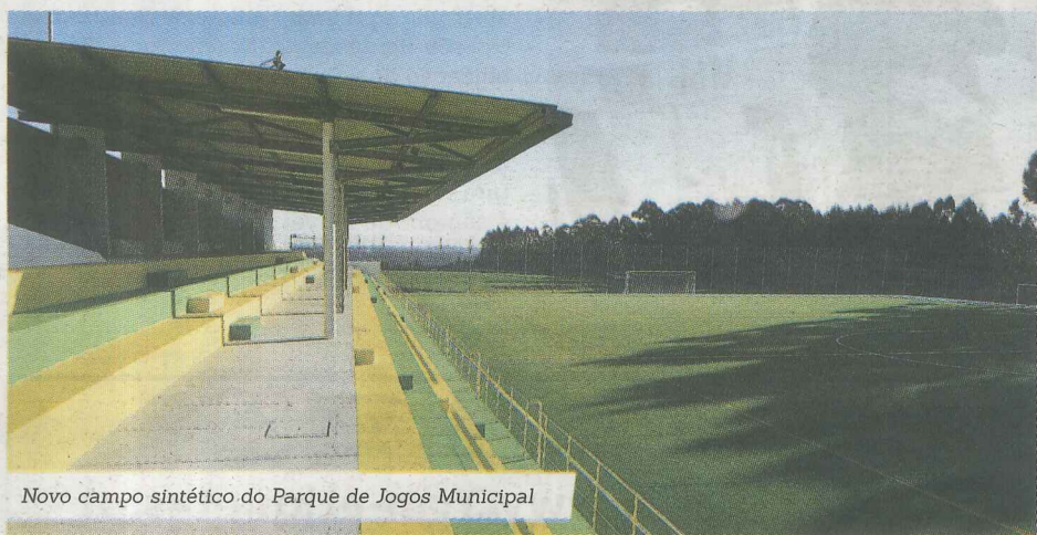
Novo campo sintético do Parque de Jogos Municipal

lhio" informou a autarquia vila-condense. Com este novo equipamento, o espaço desportivo poderá proporcionar aos atletas e à população em geral condições para a prática do futebol.