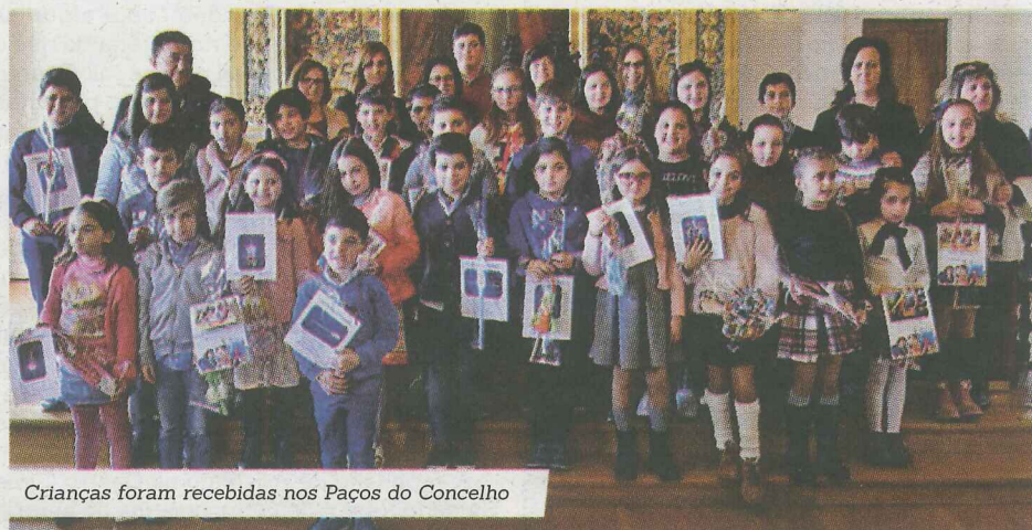
Crianças foram recebidas nos Paços do Concelho